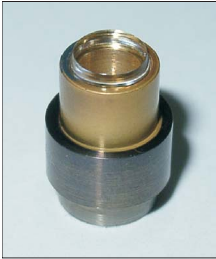
Ausführungsbeispiel Design example