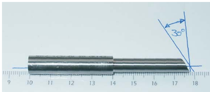
Endoskop-Schutzhülle / Endoscope Protection Cover