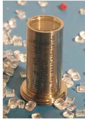
Sonden (M 16x1 Gewinde) / Probes (M 16x1 Thread)