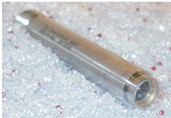
Sonde (M 22x1 Gewinde, Saphir-Linse) / Probe (M 22x1 Thread, Sapphire-Lens)